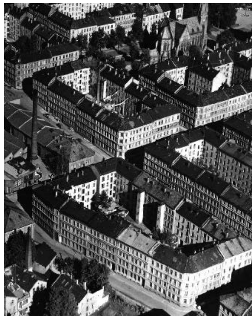
Typisk 1800-talls murgårdsbebyggelse.

Bestemmelser for å sikre verneverdier i bygninger, andre kulturminner, og kulturmiljøer, herunder vern av fasade, materialbruk og interiør, samt sikre naturtyper og annen verdifull natur