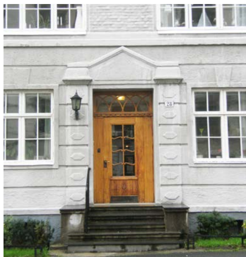
Over, Erling Skjalgssons gate 28 (ca. 1920) og t.h. Oscars gate 43, (1899). I begynnelsen av 1920-årene ble porter og dører med kun én midtstilt dør vanlig. Sidepartiene var da utført med skåter, slik at større gjenstander kunne få passasje.

Dersom en kopi er eneste mulighet, er det viktig at denne lages så nøyaktig som mulig. Man bør ikke falle for fristelsen til å forenkle det opprinnelige uttrykket; da mister kopien mye av sin verdi. Porten eller døren vil med gode materialer og godt vedlikehold fint kunne stå i mer enn 100 år. Det er i dét perspektivet økonomien og beslutningene om dørutformingene bør vurderes. Husk også å flytte over eldre gangjern, låsbeslag og dørvidere. Disse kan enkelt pusses opp. Det vil være med på å gi den nye kopien et mest mulig autentisk uttrykk, og skape sammenheng med arkitekturen for øvrig.