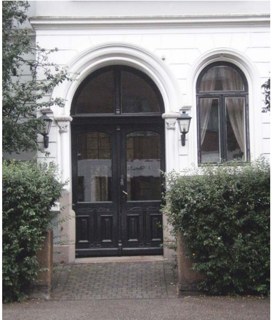
Camilla Colletts vei 5 (midten av 1890-årene) har beholdt sine opprinnelige inngangsdør med dekorative glass med etsket motiv. Camilla Colletts vei 12B (ca. 1902)