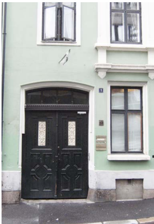
Peder Claussons gate 1, (1873), har en porttype som ble mer vanlig fra 1880-årene, oftest med en høyere overdel, gjerne gjennombrutt og en mindre underdel utformet som en brystning.