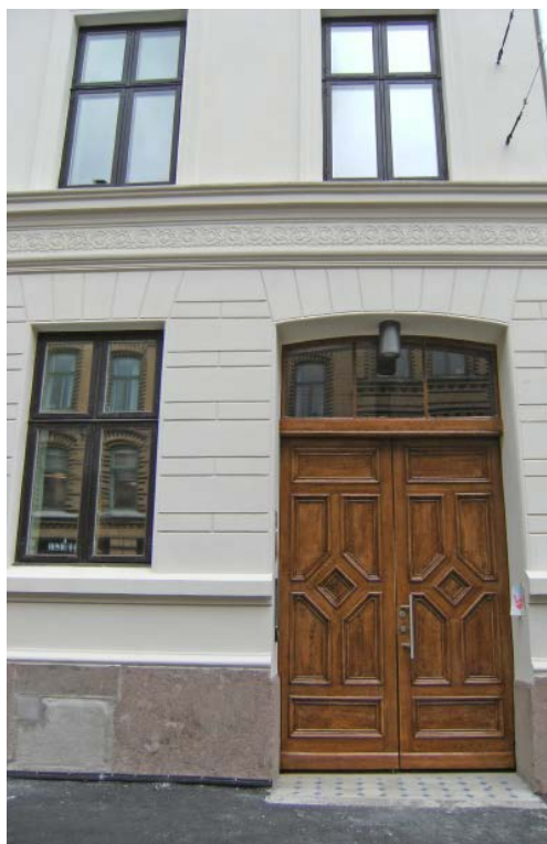
Pilestredet 30A fra 1860, har fått tilbakeført inngangsporten til ådret utførelse