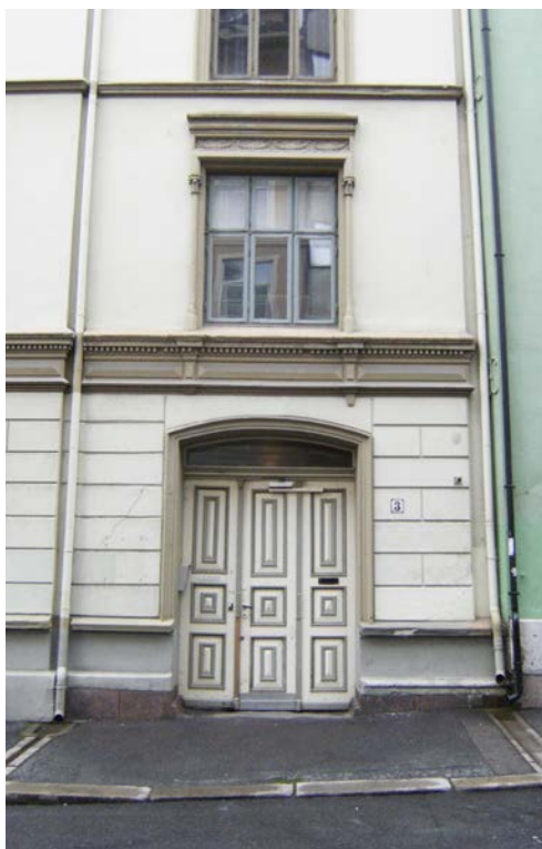
Peder Claussøns gate 3, oppført 1873, har uoriginal fargesetting.

Fasadetegningene var ofte tegnet uten at dørens detaljering ble vist, så her er det dessverre muligheter for å bli skuffet. En tur i nabolaget vil kunne føre til at en tilsvarende utformet port finnes. Da kan man enkelt kopiere og tilpasse detaljene. Plan- og bygningsetaten kan ha aktuelle byggemeldingstegninger i original eller kopi. Opprinnelige originaltegninger kan også finnes i Byarkivet. For å få tilgang der, må man få henvisning fra Plan- og bygningsetaten. Historiske foto kan finnes følgende steder; Byarkivet, Riksantikvaren, Oslo Bymuseum, Fortidsminneforeningen; Oslo- og Akershus avdeling, Norsk Folkemuseum og Nasjonalbiblioteket. Byarkivet og Nasjonalbiblioteket har fotosamlinger på internett – se web adresser nedenfor.