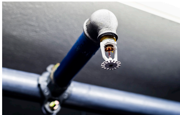
Du må ikke demontere eller henge ting på sprinklerhoder.

Hvis du har et sprinklerhode inne i leiligheten din er det veldig viktig at du ikke henger ting på dette, eller dunker ting bort i det. Da kan det komme til å sprute vann ut, selv om det ikke brenner.