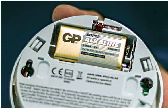
Husk å skifte batteri i røykvarsleren din.