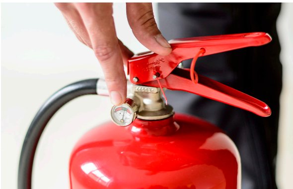
Pila på brannslukningsapparatet skal være på grønn.

Du har også ansvaret for å kontrollere at brannslukningsapparat finnes i din bolig og at det er i orden. Pila på trykkmåleren på apparatet skal peke på det grønne feltet, og apparatet skal ikke ha synlige skader. Apparatet skal ha en datostempling og som hovedregel skal apparatet kontrolleres hvert femte år og skiftes ut hvert tiende år. Du kan kontrollere apparatet ved å snu det på hodet i 5–10 sekunder, og høre etter om pulveret er løst. Hvis du ikke hører at pulveret beveger seg inne i apparatet, bør du bytte det ut.