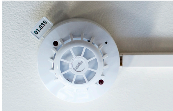
I seriekoblet brannvarslingsanlegg skal du ikke skifte batteri.