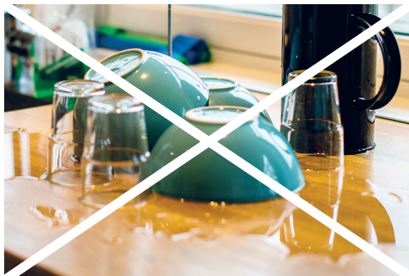
Husk å raskt tørke opp vann på kjøkkenbenken når du har tatt oppvasken. Vannsøl kan ødelegge gulv og benker.

Søppel: De siste årene har Boligbygg jobbet mye for å lage et enda bedre system for søppeltømming med mange nye søppelbrønner. Bruk disse – søppel som blir stående i fellesområder lukter vondt, og er ubehagelig for naboer og for bomiljøet. Matavfall kan også tiltrekke seg insekter og skadedyr. Derfor er det viktig at du kaster søppel i søppelcontainer/søppeldunker. Husk også at du må sortere avfallet i grønn og blå pose slik Renovasjonsetaten krever. Hvis du har møbler du ønsker å bli kvitt, husk at du ikke kan sette dem i fellesområder eller utenfor søppelhusene, men at du må få dem fjernet selv.