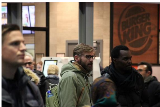
Fra samfelling med bydel Østensjø.

SaLTo samarbeidet er Oslo kommunes SLT (Sammen lager vi et trygt Oslo) , og er et viktig verktøy i kommunens rus- og kriminalitetsforebyggende arbeid overfor barn og unge opp til 23 år. Uteseksjonen koordinerer arbeidet i Oslo sentrum og deltar i regional gruppe sammen med sentrumsnære bydeler. Det gjennomføres 2 ukentlige møter med aktuelle aktører i Oslo sentrum for gjensidig oppdatering samt koordinering av arbeidet. Uteseksjonen holder hvert år 4 større nettverksmøter, «Barn og unge i sentrum» der aktørene i sentrum møtes.