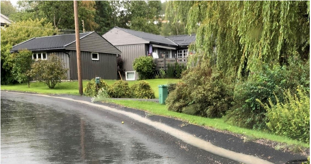
Figur 8. Gate med ensidig fall. Tidligere rant vannet på motsatt side av veien og inn mot privat bebyggelse. Vannet renner nå kontrollert mot Lundebekken uten å være til skade for hus og kjellere etter at tverrfallet ble snudd.