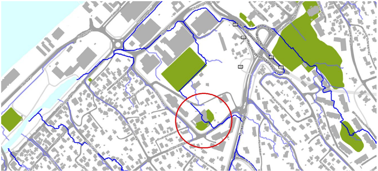
Figur 1. Avrenningslinje viser hvordan vannet vil renne forbi eksisterende bebyggelse. En bedre løsning er å styre vannet mot venstre og bruke kommunal vei som flomvei. Illustrasjon: Porsgrunn kommune