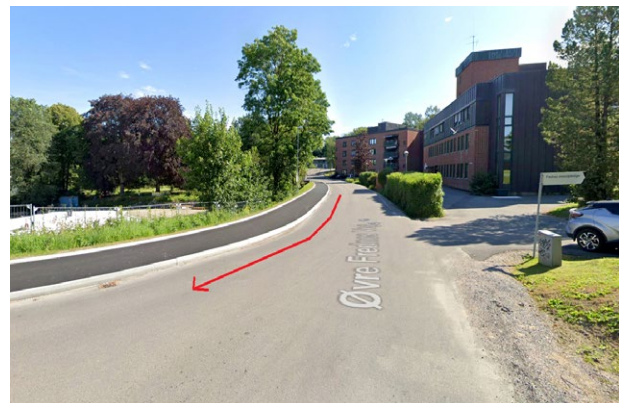
Figur 5. Etter tiltak: veien er rettet ut for å unngå lavpunkt hvor vann kan samle seg. Nytt fortau med høye kantstein løper jevnt nedover og hindrer vannet i å renne ned mot barnehagen som er under oppgradering på bildet.