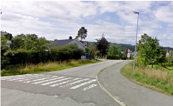
Figur 2. Før tiltak: En relativ beskjeden forhøyning (fotgjengerfeltet) er nok til at vannet hindres i å renne ned veien.