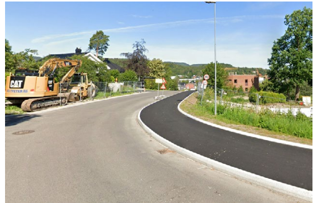
Figur 3. Etter tiltak: Veien er jevnet ut og vannet kan renne trygt nedover kommunal vei uten å forhindres av den tidligere forhøyningen.

I tillegg var opphøyd fotgjengerfelt i figur 2 en sperre for at vannet kunne renne videre nedover den kommunale veien. I lavpunktet samlet vann seg før det rant over kantstein mot gangvei og ned mot barnehagen (figur 4).