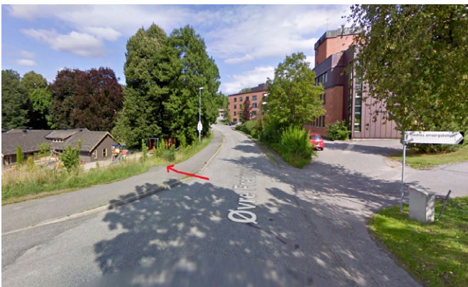
Figur 4. Før tiltak: Rød pil indikerer vannets naturlige vei før veitiltak ble gjennomført. Vannet samles i et lavpunkt og renner enkelt over nedsunken kantstein, ned mot barnehage og videre bebyggelse.

I tillegg var opphøyd fotgjengerfelt i figur 2 en sperre for at vannet kunne renne videre nedover den kommunale veien. I lavpunktet samlet vann seg før det rant over kantstein mot gangvei og ned mot barnehagen (figur 4).