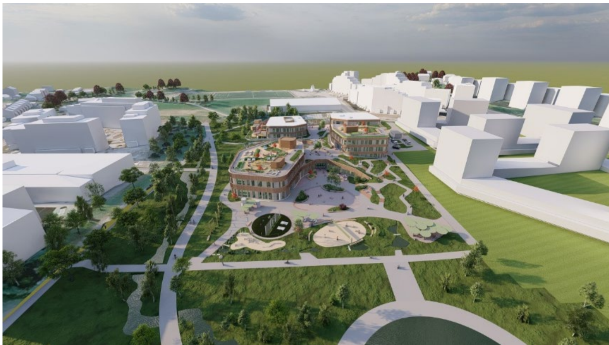
Figur 4: Perspektiv fra Sør. L2 Arkitekter.