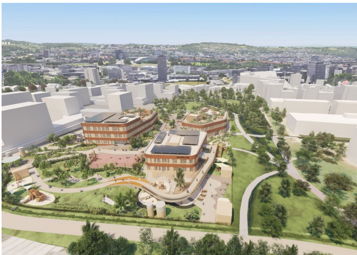
Figur 3: Perspektiv fra Nord. Grindaker AS.