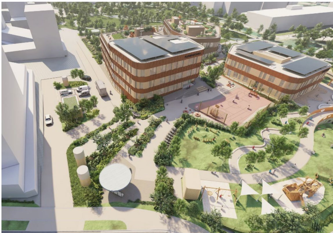
Figur 2: Perspektiv adkomst og gatetun. Grindaker AS.

Nedenfor er noen illustrasjoner av hvordan skolen skal se ut når den er ferdig.