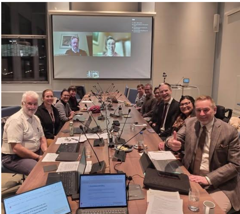
Begeistring på rådmøtet da CRPD-innstillingen fra Stortingets justiskomite ble kjent. Bilde fra rådmøte 2. desember 2025.