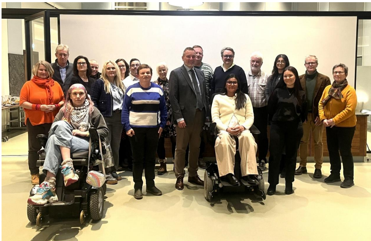
Bilde fra konstituerende møte for rådsperioden 2024-2027

Rådet legger FN-konvensjonen om rettighetene til mennesker med nedsatt funksjonsevne (CRPD) til grunn for sitt arbeid. Rådets arbeidsprogram inkludert fullstendig liste over prioriterte handlingspunkter er tilgjengelig på rådets hjemmeside her .