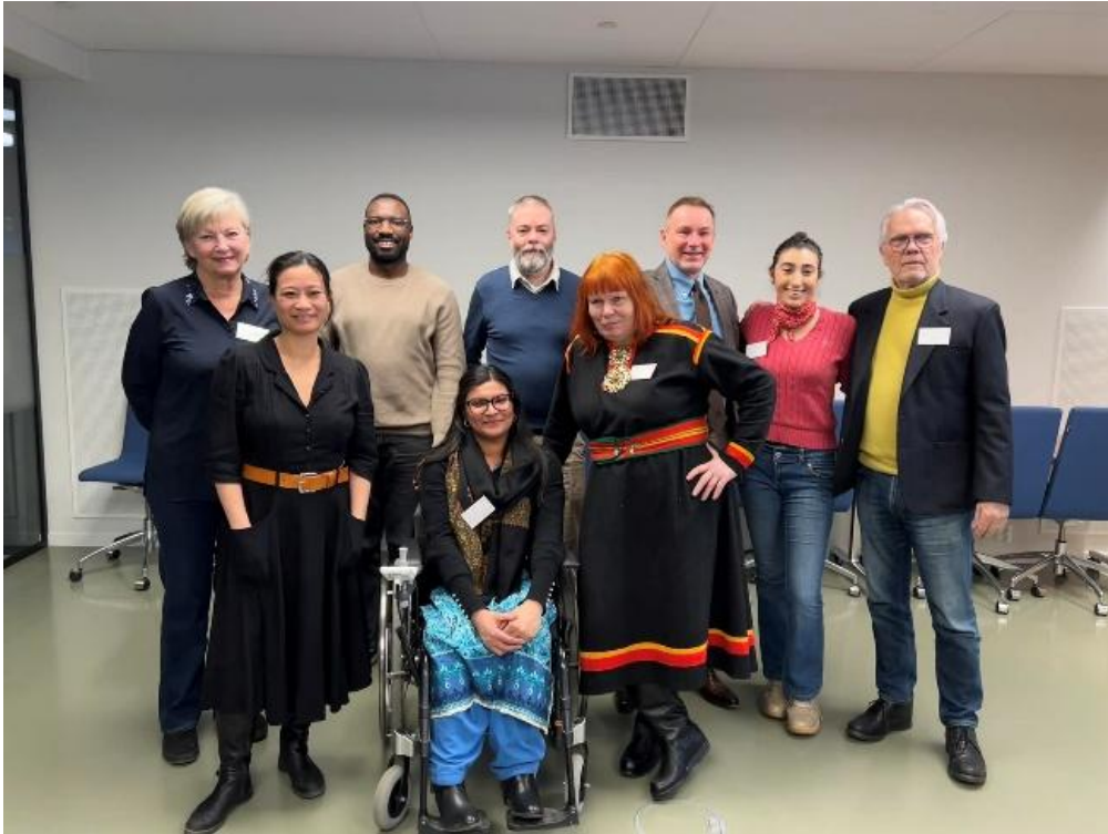
Bilde fra samarbeidsmøte ledere og nestledere i sentrale råd og utvalg 12. februar 2025