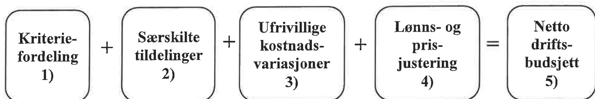
Figur 1.3 Netto budsjettramme for ordinær drift som fordeles til den enkelte bydel

Budsjettrammen for bydelene består av en politisk bestemt ramme pr. funksjonsområde hvor kompensasjon for ufrivillige kostnadsvariasjoner, særskilte tildelinger og sentrale avsetninger trekkes fra rammen før selve kriteriefordelingen utføres. Sentrale avsetninger avsettes til spesielle formål og fordeles bydelene i løpet av budsjettåret.