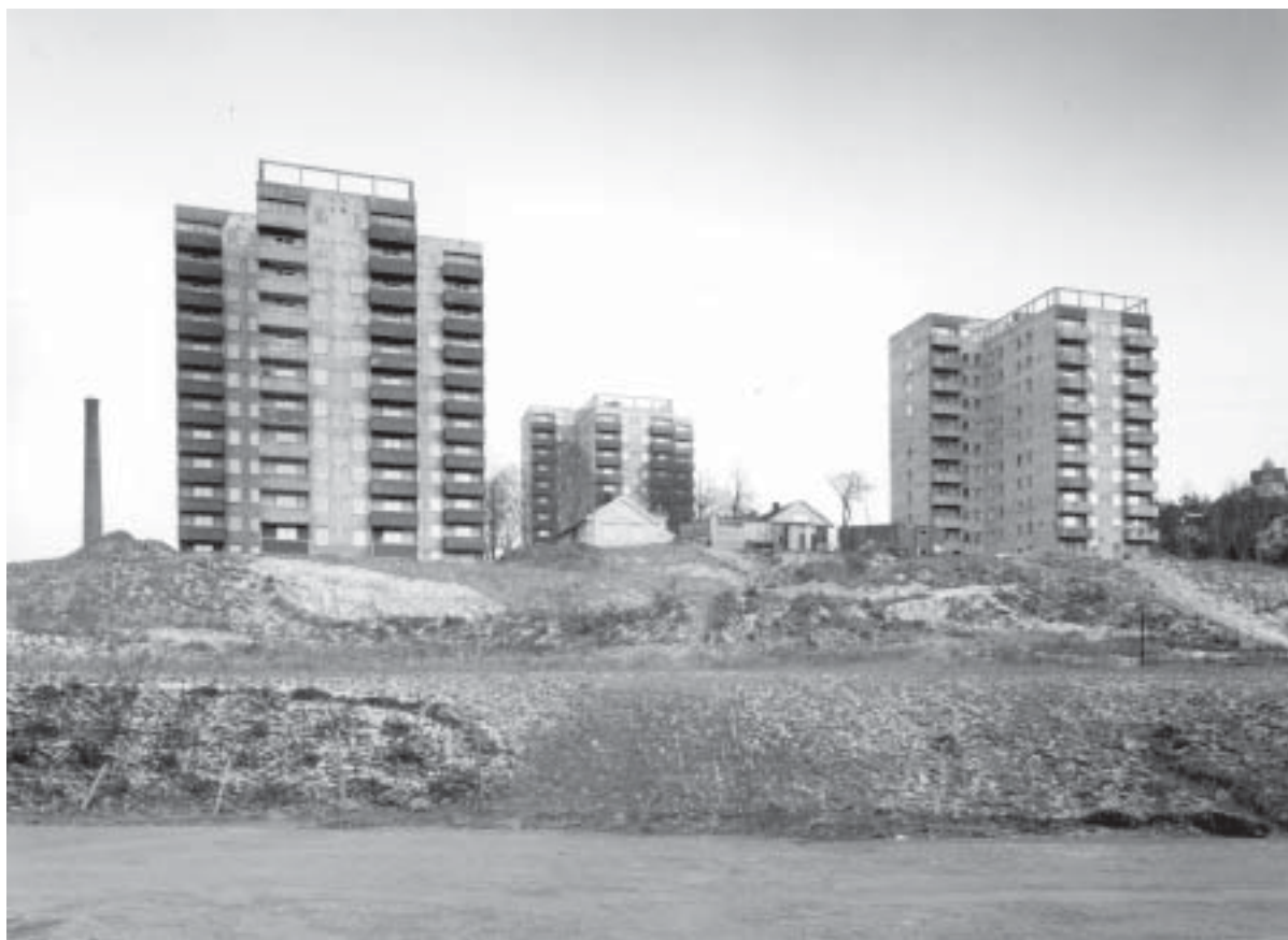
Bosetningen i de fleste bydelene ble en blanding av gammelt og nytt, stort og smått. Punkt-blokkene på Nygård står i sterk kontrast til det gamle gards-tunet, villa-bebyggelsen ovenfor og industrien i Lodalen og på Bryn.

Grensene ble satt med bakgrunn i en rekke kriterier: Natur og geografi og allerede eksisterende soneinndelinger fra helsesektor, skole og politiske