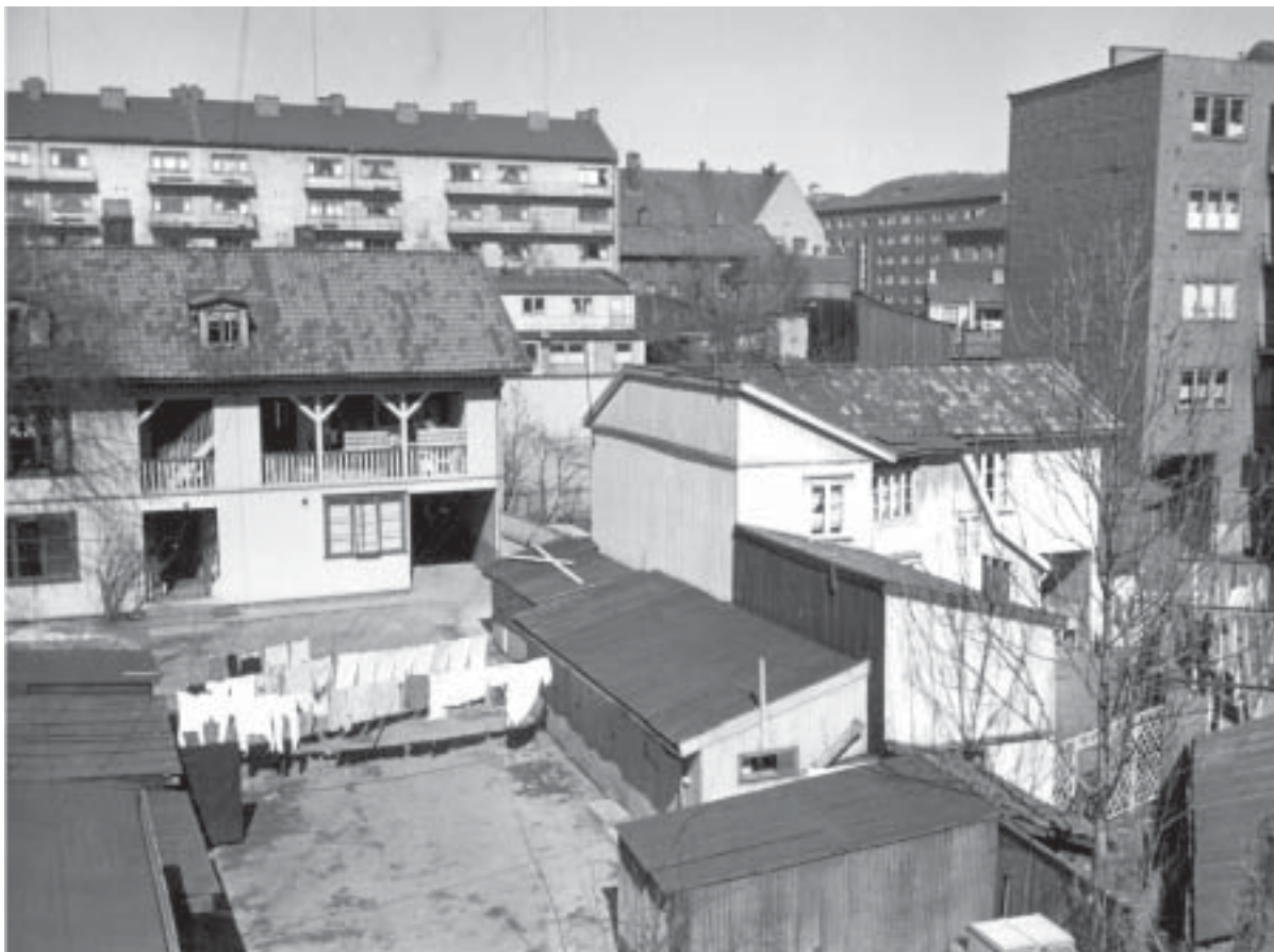
Bydeler skifter ham. Bjølsen-jordet er en av de gamle treforstedene som ble innlemmet i Kristiania i 1878. I 1973 ble det vedtatt å sanere det hele, og i dag domineres bebyggelsen av USBI-blokker.

mandat for å finne ut hva merforbruket skyldtes. Et sted viste det seg at økonomikonsulentene var kommandert i annet arbeid (!) uten noen erstatting. Et annet sted var problemet tilskudd som skulle fordeles og bli mottatt på bakgrunn av drift av private sykehjem, men komiteen konkluderte med at hovedproblemet lå i manglende økonomisk styring, dårlig oversikt og manglende rutiner. Noen bydelsdirektører måtte forlate sine stillinger – andre steder fikk man hjelp til å rydde opp. Fra 1991 ble Kriteriesystemet innført hvor bydelene fikk et budsjett på bakgrunn av befolkningens størrelse og sammensetning med sosioøkonomisk status som viktig element.