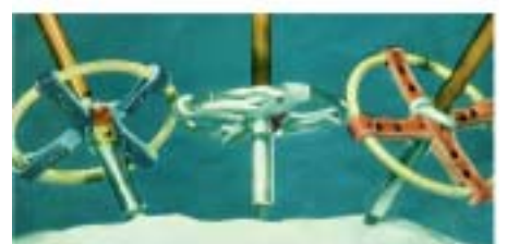
Plakat fra Byarkivets OL-utstilling