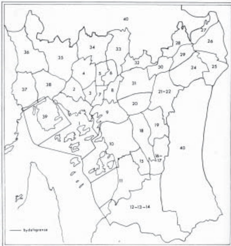
Bydelsinndelingen fra 1973 (over) ble et viktig utgangspunkt når grensene for de 25 administrative bydelene skulle trekkes i 1987/88 (under). (Kart fra Statistisk årbok for Oslo 1983 og 2001)