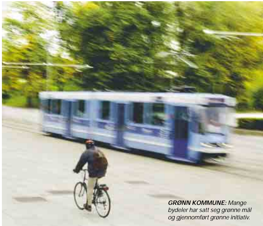
GRØNN KOMMUNE: Mange bydeler har satt seg grønne mål og gjennomført grønne initiativ.

«Kommunen har etablert et samarbeid med alle sektorer i bysamfunnet; staten, næringslivet og frivillige organisasjoner. Sentralt i dette samarbeidet står Forum for Bærekraftig By.»