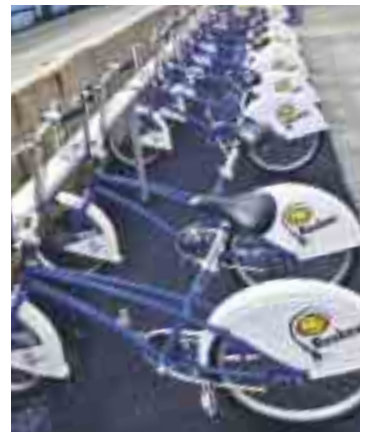
KLAR TIL BRUK: 90 bysykler venter på deg.

Hvor mye av bygningsmassen har energifleksible løsninger? Når vi kan måle en indikator, kan vi også se om vi forbedrer oss. www.mos.oslo.kommune.no