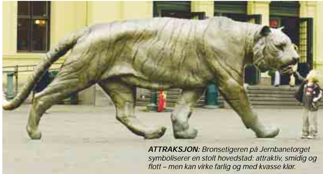
ATTRAKSJON: Bronsetigern på Jernbanetorget symboliserer en stolt hovedstad: attraktiv, smidig og flott – men kan virke farlig og med kvasse klør.