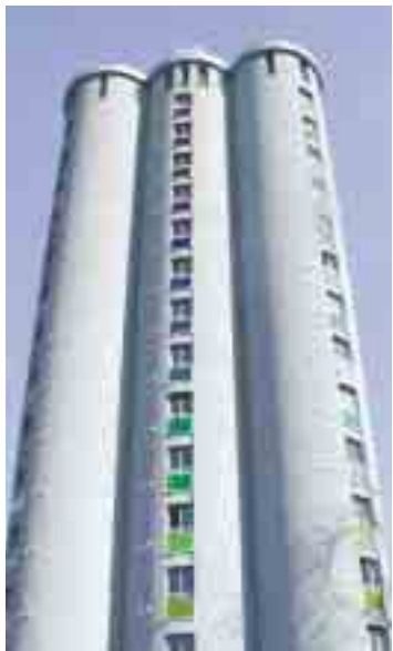
GJENBRUK: Studenthybelhuset på Nedre Grünerløkka har gitt nytt liv til gammel kornsilo.

Guiden finner du elektronisk på www.nabu.no