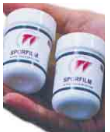
RADIOAKTIV MÅLING: Små bokser med sporfilm brukes for å måle mulig radon i boliger.

www.sam.oslo.kommune.no og om bysyklene på www.adshel.no