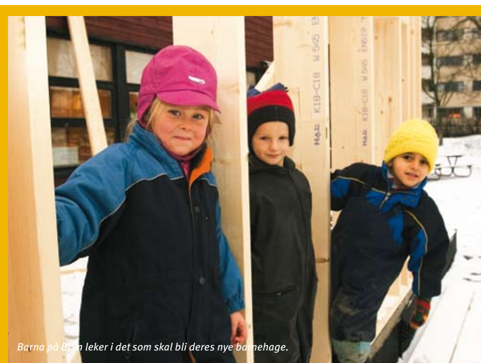
Barna på Brøn leker i det som skal bli deres nye barnehage.

Barn trenger trygge steder til lek og opphold. Ungdom trenger samlingssteder. Å sørge for disse gruppene på gamle og nye møteplasser, er en viktig del av planarbeidet. Derfor har ungdomsorganisasjonene, gjennom ungdomsrådene i bydelene, vært invitert med. De kjenner bydelen og vet best hvilke ønsker og behov barn og ungdom har. Det er viktig at de som planlegger får vite om dette. Målet er at alle bydelene skal ha best mulig fysiske omgivelser for barn og ungdoms oppvekst og utvikling.