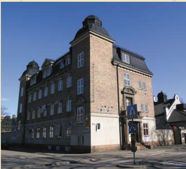
Den ene delen av anlegget som ble bygd står dere fortsatt og huser i dag deler av bydelsadministrasjonen.

Interningsbygget brukes i dag til tjenester under bydelsadministrasjonen.