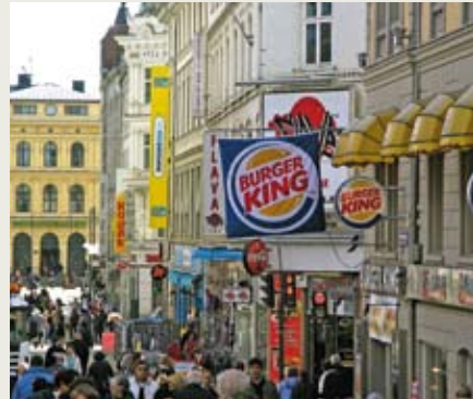
Den nye planen har som mål å rydde opp i reklameskiltjungelen i Oslo.

Planen lå ute til offentlig høring i vår. Den sendes til Rådhuset til politisk behandling før sommeren.