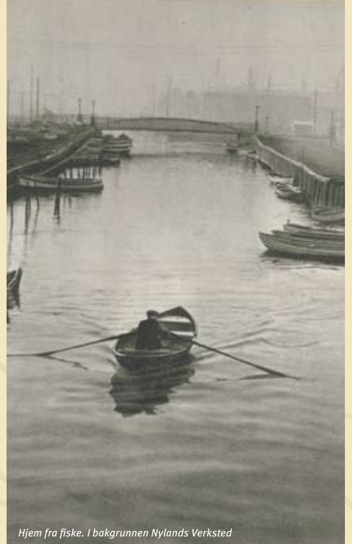
Hjem fra fiske. I bakgrunnen Nylands Verksted