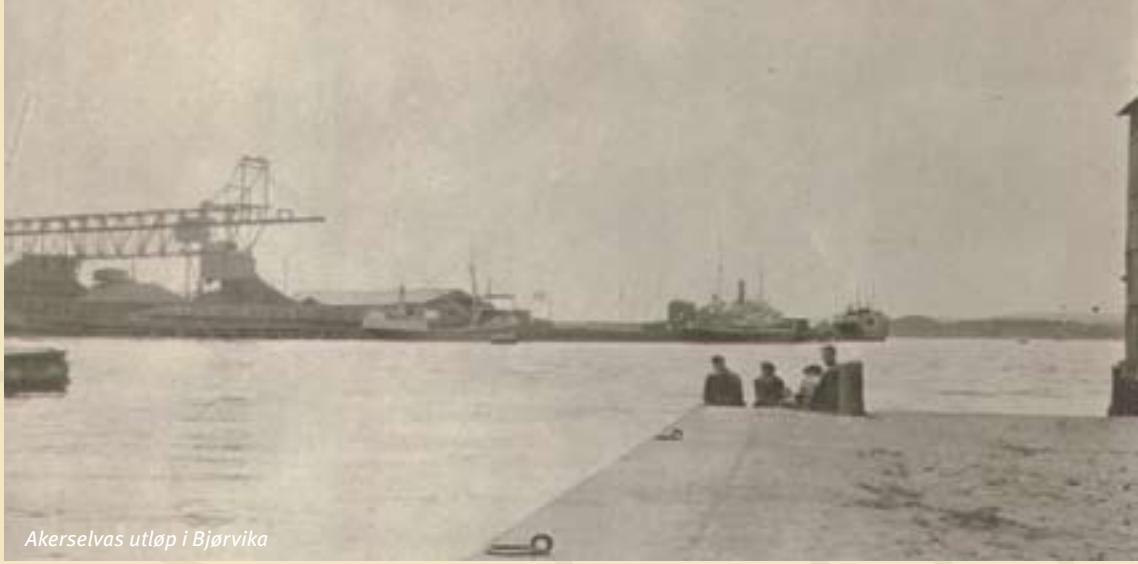
Akerselvas utløp i Bjørvika