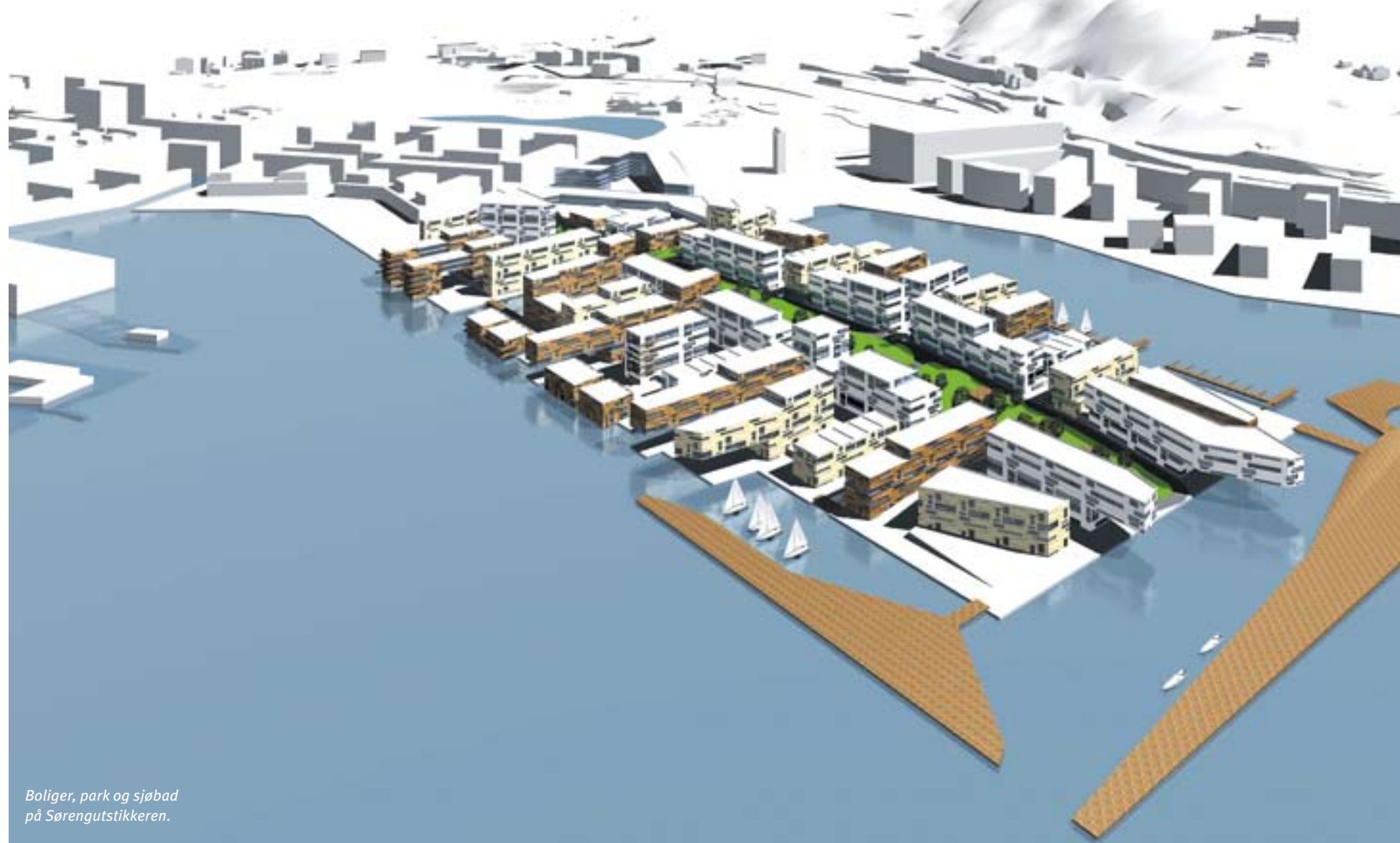
Boliger, park og sjøbåd på Sørengutstikkeren.

Bebyggelsesplanen for Sørengutstikkeren legges ut til offentlig ettersyn i mai/juni. Byggingen forventes å starte høsten 2009.