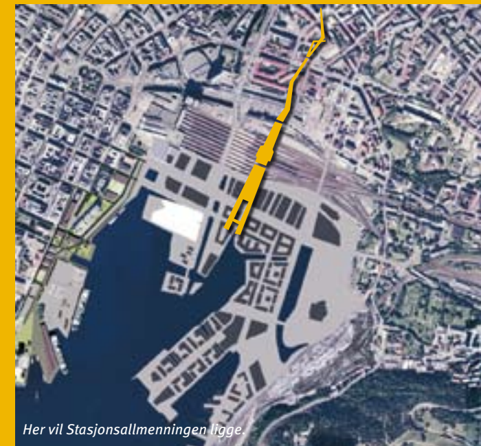
Her vil Stasjonsallmenningen ligge.

– Broen vil få en litt varierende form og gi romslig plass til fotgjengere. Videre er allmenningen lagt til rette for byliv med servering, parkrom og benker. Det vil bli handel og kulturliv langs allmenningen, og det er satt av områder til lek, til restauranter osv. – Nå er vedtaket gjort, og