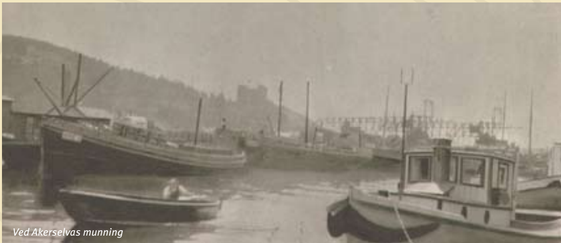
Ved Akerselvas munning