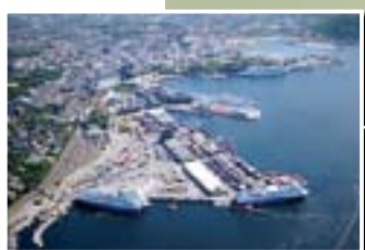
Boliger på Filipstad

– Ja, det er jo nå planlagt trikk fra Bjørvika til Skøyen. Forbi Aker Brygge og Filipstad må den trekkes litt inn fra selve havneområdet, men for det meste vil den følge havnepromenaden. Det kommer til å bli et stort løft for kollektivtrafikken og en attraksjon i seg selv! Fra Bjørvika er det kort vei til trikkeskinnene i Gamlebyen, og fra Skøyen kan den nye «fjordbytrikken» kobles til en bybane-forbindelse til Fornebu. Vesentlig her er at